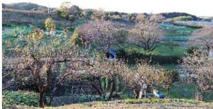
初冬の岡上営農団地

以前、三輪緑山の標高がどのくらいあるかというお話をしました。バス停「三輪緑山 2 丁目」付近が比較的高いのですが、このあたりから西側に見る岡上営農団地方面の景色が素晴らしいと思います。春には桃、桜、菜の花が咲き誇り、まさに里山を感じさせる風景です。何年か前に大雪が降ったときは見渡す限り銀世界になり、それはとても美しい眺めでした。