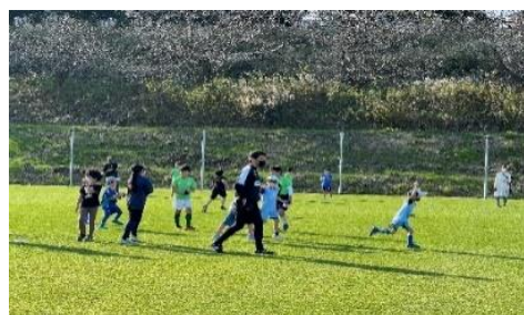
子どもふれあいサッカー