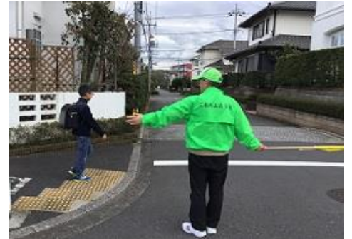
登下校パトロールの様子

今年度も緑山では、防犯・交通安全協力会と緑山子ども会とで登下校の見守りパトロールを行います。 子ども達の安全を地域で見守る緑山。 これからも元気に楽しく通学して欲しいものです。