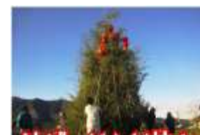
地域のどんど焼き