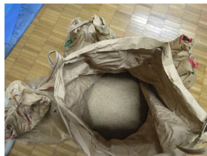
収穫したお米 (1袋 20Kg X 4)